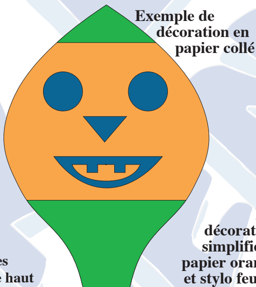
Exemple de décoration en papier collé