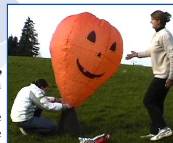
Ici, décoration simplifiée : papier orange et stylo feutre