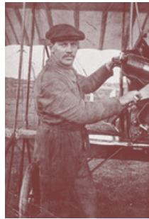
René Caudron (1882-1959)