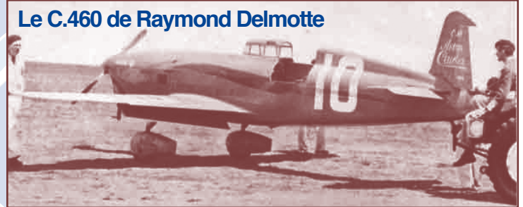
Le C.460 de Raymond Delmotte

La coupe Deutsch de la Meurthe fut à nouveau remportée par un C.450 piloté par Raymond Delmotte à 443,965 km/h. La deuxième place était remportée par un C.460, la troisième par un C.450.