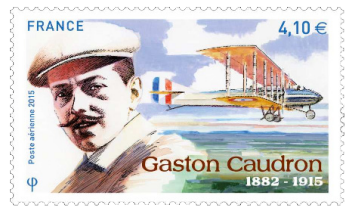
Gaston Caudron (1882-1915)

Créée par les frères Caudron en 1909, la société des avions Caudron développa des avions performants dès le début de la Première Guerre mondiale.