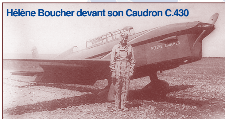
Hélène Boucher devant son Caudron C.430